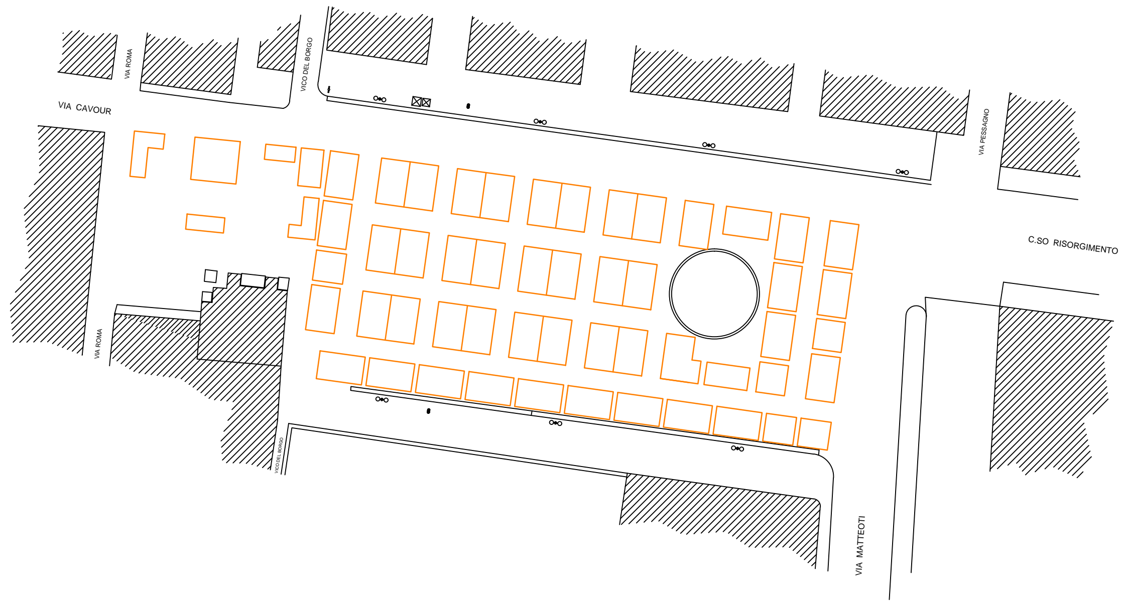
RIPRODUZIONE DELL'ORGANIZZAZIONE DELLE POSTAZIONI COME PLANIMETRIA INSERITA NEL PERIMETRO ATTUALE STATO APPROVATO CON DELIBERA DI CONSIGLIO COMUNALE NUM. 70 IN DATA 29/07/1997 - SCALA 1:500