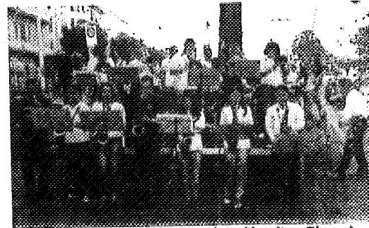
Alcuni momenti della manifestazione "Musica e gusto", nel centro storico di Lavagna