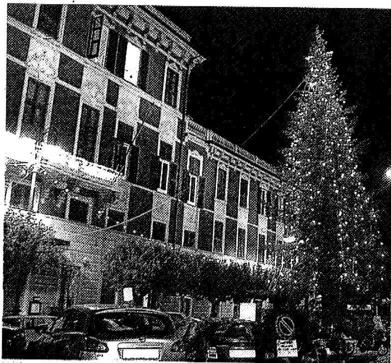
Un'immagine di repertorio dell'albero di Natale installato in piazza della Libertà a Lavagna e delle luminarie su Palazzo Franzoni

Al riferimento di Mazreku e all'ultimissima vertenza che contrappone "Porto di Lavagna" al Comune. Nei giorni scorsi il consiglio comunale ha bloccato il progetto di "Lavagna futura" per il rilancio dello scalo e poche settimane prima "Porto" aveva aperto con il Comune l'ennesimo conflitto giudiziario, motivato dalla procedura pubblica avviata dall'amministrazione dopo che "Porto di Lavagna Spa" aveva presentato, in allegato al progetto di riqualificazione dell'approdo, una richiesta di proroga di 35 giorni della concessione demaniale quinquennale in scadenza nel 2014. «Non era una nuova concessione», sottolinea l'amministratore delegato di "Porto di Lavagna" - ma una richiesta per consentirci di ammortizzare un investimento da 50 milioni di euro. Il Comune ha commesso un errore, penso in buona fede, adesso attendiamo i 90 giorni che devono trascorrere per la chiusura della procedura e poi speriamo che si possa riaprire il lavoro. Le nostre porte sono aperte». Chissà che il contributo per le luminarie, erogato ai commercianti e non al Comune, aiuti a