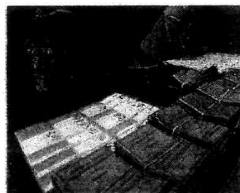
Scrutatori al lavoro