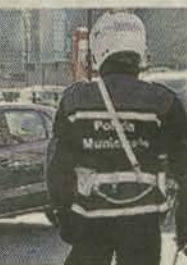
La polizia municipale ha condotto l'indagine

aveva voluto che, nel pomeriggio dello scorso 11 maggio, non si verificasse una tragedia. Poi il "pirata della strada", senza la patente di guida (revocata) in sella al suo mezzo non assicurato si era dato alla fuga. Il tutto, dopo aver puntato un altro agente della polizia municipale di Lavagna. Tramite la targa dello scooter, nel giro di qualche giorno, il trentenne lavagnese, con alle spalle piccoli precedenti penali, è stato individuato e denunciato. Il mezzo è stato confiscato e demolito.