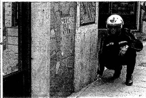
La scena dell'incidente del 5 febbraio e i rilievi della polizia municipale, ieri mattina, sulle strisce di corso Matteotti PIUMETTI