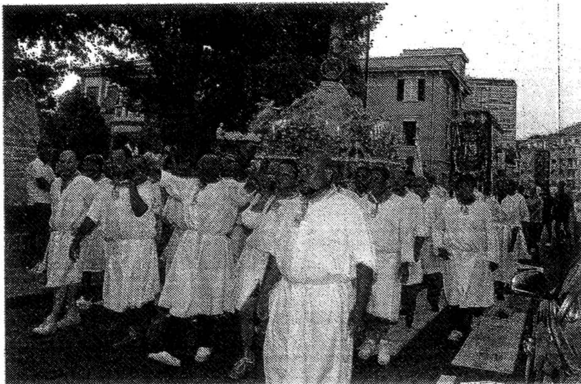
L'arca della Madonna del Carmine portata in processione per le vie di Lavagna