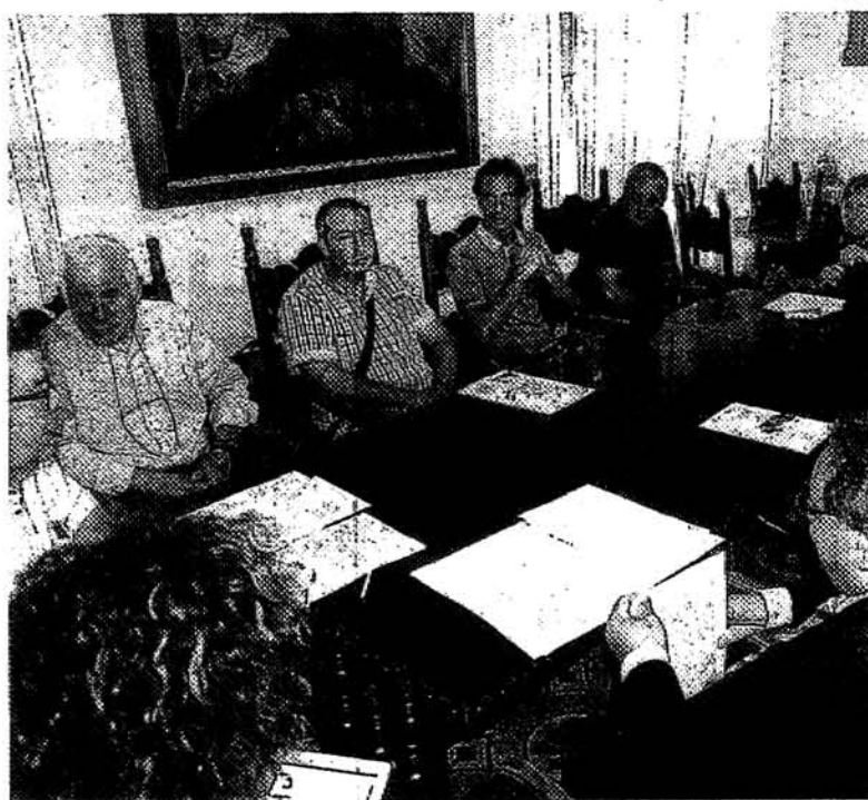
La riunione di ieri in Comune a Lavagna tra amministratori e tassisti FLASH

badinelli@ilsecoloxix.it © RIPRODUZIONE RISERVATA